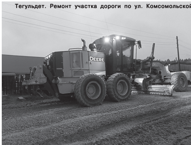
Тегульдет. Ремонт участка дороги по ул. Комсомольской.