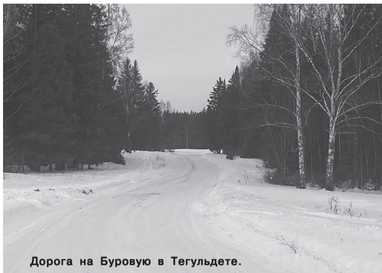
Дорога на Буровую в Тегульдете.

В течение июня силами ООО «Магистраль-70», выигравшего аукцион на сумму 1 820 тыс. руб., в Тегульдете приведена в надлежащий вид и отсыпана щебнем