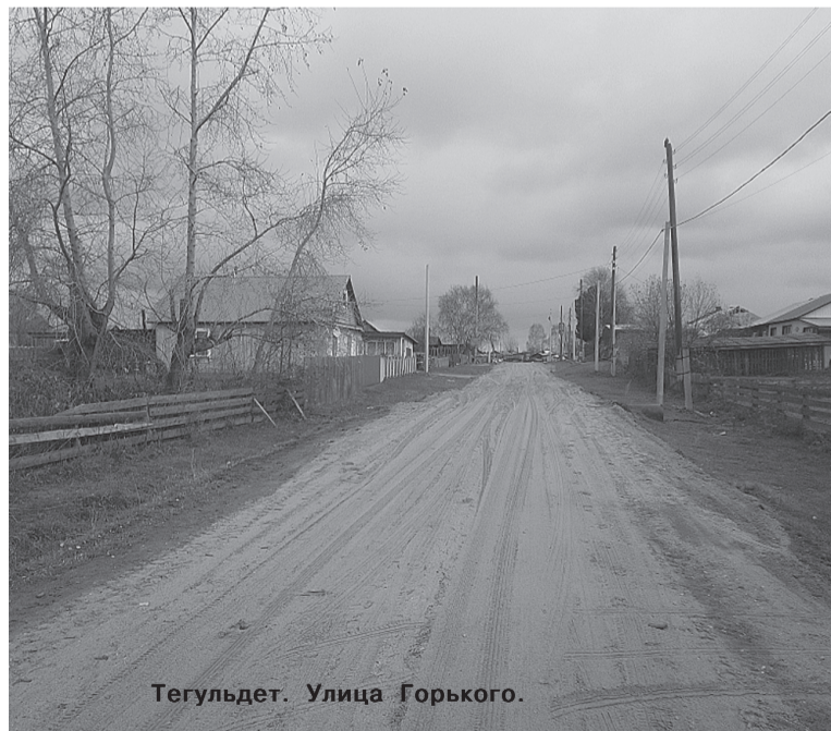
Тегульдет. Улица Горького.

«Согласно многочисленным заявлениям и обращениям жителей нашего поселения был составлен перечень дорог с целью профилирования и отсыпки их пес-