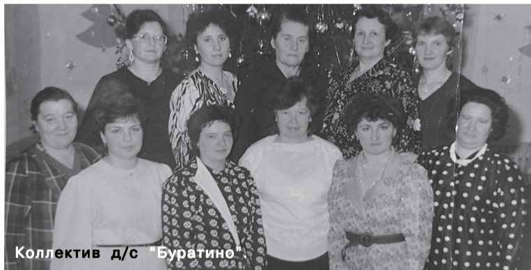
Коллектив д/с «Буратино»

Сейчас многие со мной здороваются, только я не всех узнаю - ведь они повзрослели и измени-