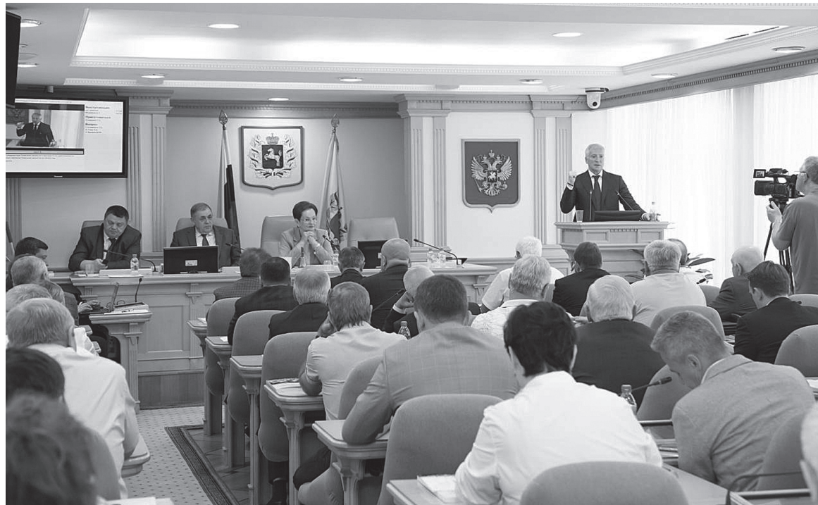
Отчёт губернатора на собрании Думы в июне 2024 г.

Вместе с Фондом защитников Отечества мы смотрели, насколько региональное законодательство отвечает