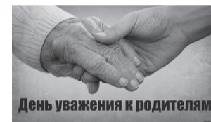
День уважения к родителям

сия)-"Голсапуш" (Иран). Прямая трансляция. 21.55 Пляжный Футбол. Московский международный кубок. "Локомотив" (Россия)-"Малайсары" (Казахстан). Прямая трансляция. 23.15 Футбол. FONBET Кубок России. Прямая трансляция. 02.30 Футбол. FONBET Кубок России. Обзор. 6+ 03.45 Формула-1. Гаснут огни. 12+ 04.15 Д/ф "Якушин. Первый среди первых". 12+ 05.20 Бильярд. BetBoom Кубок чемпионов. Трансляция из Москвы. 0+ 06.55 Новости. 0+ 07.00 Спортивная гимнастика. FONBET Кубок России. Трансляция из Новосибирска. 6+ 09.00 Автоспорт. Ралли-рейд "Шёлковый путь". 6+