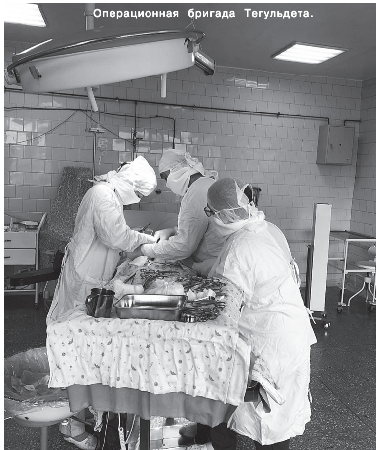
Операционная бригада Тегульдеты.

Железные нервы, хладнокровие, выдержка, спокойствие, терпение, решительность и умение контролировать ситуацию даже в самых сложных ситуациях - вот неполный список поведения операционной бригады. Однако с этой тяжёлой нагрузкой, требующей ответственного подхода, наши тегульдетские медицинские работники успешно справляются.