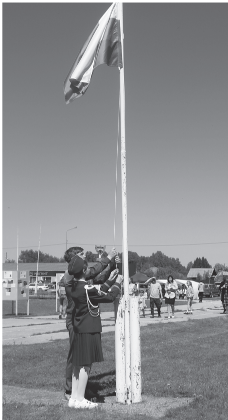
12 июня отмечался большой праздник - День России.

«Мы живём в великой стране с не менее великой историей. Нашими учёными сделаны важные открытия, а достижения культуры могут позавидовать многие другие народы мира», - с этих слов ведущего начался уличный праздник, посвящённый Дню России на стадионе «Таёжный» в Тегульдете.