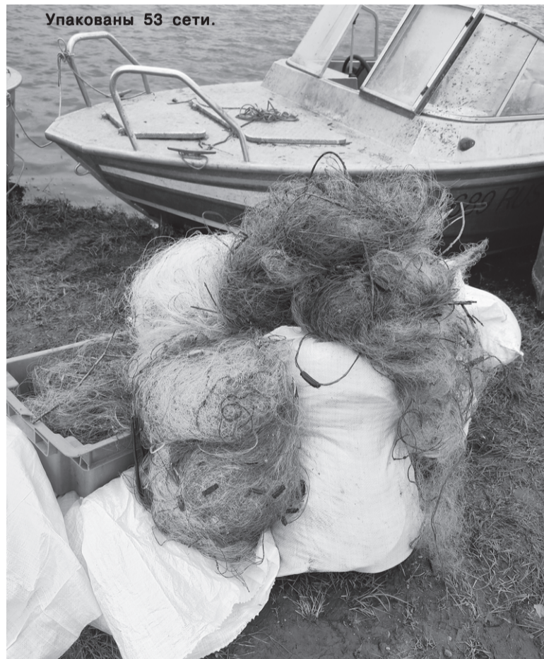
Упакованы 53 сети.

од на этом водоёме и любые сети. По новым правилам сети запрещено перевозить даже в собранном виде ближе, чем 500 метров до реки.