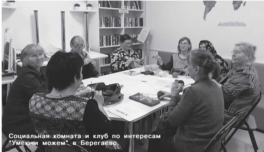
Социальная комната и клуб по интересам "Умеючи можем" в Берегаево.

Тепло, заботу, добро, которые щедро дарят сотрудники центра всем нуждающимся в них, переоценить невозможно. Этот благородный вклад очень нужен тем, о ком мы ежедневно и неустанно заботимся. Уверена, что жизненный опыт и профессионализм наших коллег станет основой для дальнейшего успешного решения стоящих перед нами ответственных задач совершенствования и развития социального