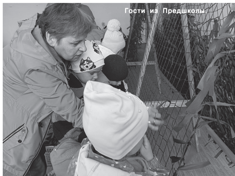
Гости из Предшколы

«Вначале мы выписывали ткань через Wildberries. Потом я изучила, как делают другие. Специально ездила в Зональную Станцию, где посмотрела, как режут ленты. Потом связалась с их координатором, чтобы помогли купить ткань по более низкой цене - ткань в бобинах, а сети в куклах. Договорилась о поставке, которая на-