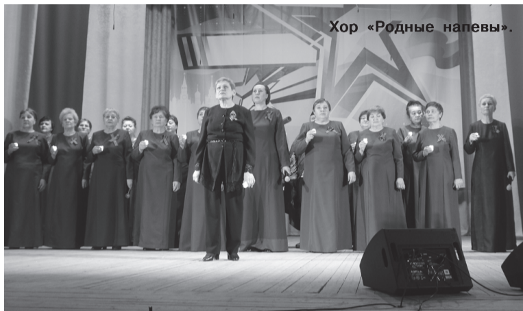
Хор «Родные напевы».

15 февраля наша страна отметила 35 лет со Дня вывода советских войск из Афганистана, и прежде, чем начался районный конкурс, творческие коллективы РЦТид и Детской школы искусств представили театрализованную публицистическую программу «Долгая дорога памяти», посвящённую этой памятной дате. Она включает в себя рассказ о ветеранах боевых действий Тегульдетского района, прожитая жизнь за 2 года службы, что чувствовали и что смогли прожить ещё совсем юные парни, находясь в зоне боевых действий за пределами Отечества. Каждый из них увидел страх в лицо, но не сдался. Так воспитала Родина советского