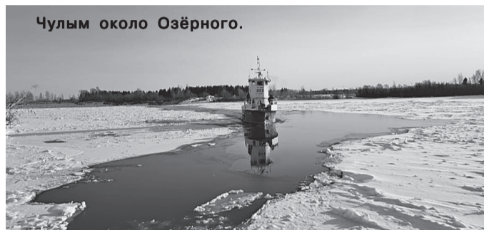
Чулым около Озёрного.