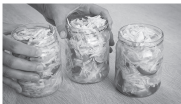
Маринованная капуста с перцем сладким и чесноком

Разложить в банки. В банку нужно утрамбовать плотно. Хранить в холодном месте. Такая капуста с овощами идёт на ура и в салаты, и в борщ.