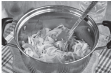
Салат из капусты "Витаминный"

Только закончился август, а у многих в огороде уже потрескалась капуста. Рано, конечно. Засолкой обычно занимаются в октябре. Но что можно из неё сделать сейчас? Ловите рецепты.