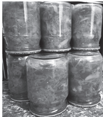
Салат на зиму "Парамониха"

Перец сладкий - 1 кг; морковь - 1 кг; помидор - 2 кг; лук репчатый - 1 кг; масло растительное - 300 мл; уксус (9%) - 100 мл; сахар - 300 г; соль - 50 г; перец чёрный (или красный молотый) - по вкусу.