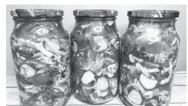
Салат "Генеральский" на зиму

Разложить горячий салат по подготовленным (простерилизованным и сухим) банкам. Закатать крышками и перевернуть дном вверх под одеяло, до остывания.