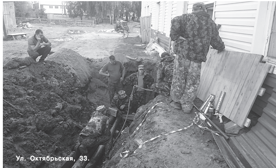
Ул. Октябрьская, 33.

развитию коммунальной инфраструктуры коммунальщики выполнили капитальный ремонт участков на теплотрассе по улицам Советской и Парковой.