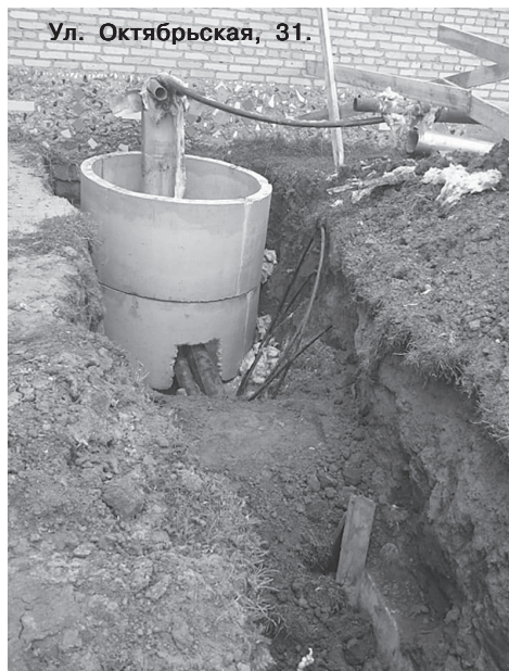
Ул. Октябрьская, 31.

Глава муниципального образования Игорь Клишин сказал: «Работники МУП «Прогресс» завершили капитальный ремонт нескольких участков теплотрассы в Тегульдете. Заменяли ветхие коммуникации на новые около жилого двухэтажного дома по улице Октябрьская, 33. До этого в рамках реализации муниципальной программы по