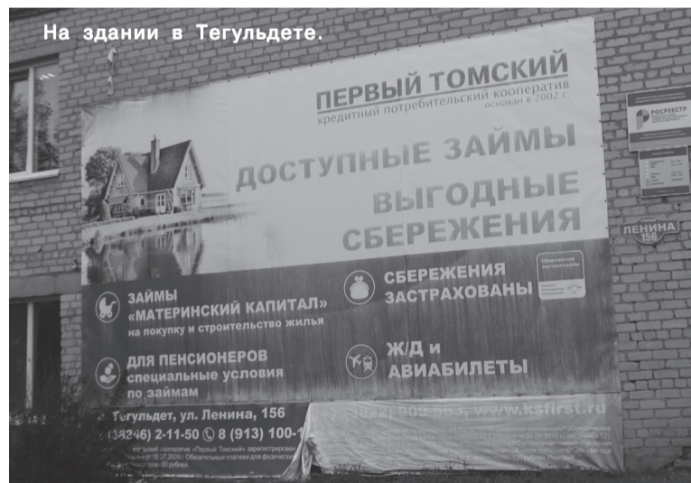
На здании в Тегульдете.

Обвиняемые группой лиц по предварительному сговору, с использованием своего служебного положения, из корыстных побуждений, систематически, в течение длительного периода времени, осуществляли хищение денежных средств, принадлежащих пайщикам кооператива, путём обмана и злоупотребления доверием на сумму более 500 млн руб. От их преступных действий пострадали около 900 граждан.