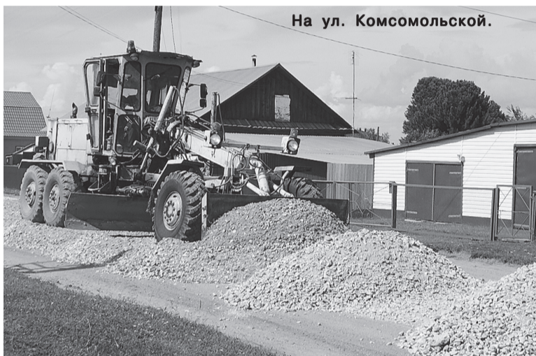
На ул. Комсомольской.

Климат Тегульдетского района континентальный. Рельеф местности сложный, полого-волнистый и увалистый. Продолжительность безморозного периода длится 105-125 дней. За это время, наверняка, все ремонтные работы будут закончены в установленные сроки. Конечно, можно вспомнить, как было когда-то, например, 10 лет назад или 20, когда по той же Комсомольской в непогоду, распутицу было вообще не проехать и даже можно было завязнуть в коле. Но жизнь меняется.