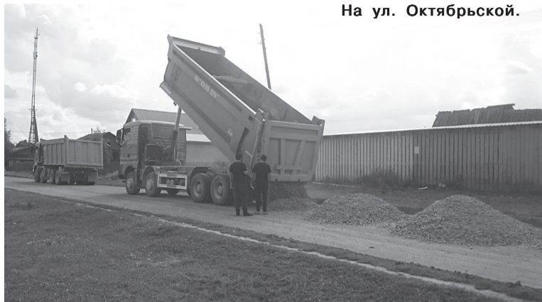
На ул. Октябрьской.