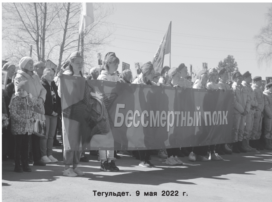
Тегульдет. 9 мая 2022 г.

В Тегульдете 9 мая «Бессмертный полк» будет проводиться, скорее всего, в онлайн-формате; поздравление от жителей района с праздником также в онлайн-формате в соцсетях. А в библиотеке будут выставки рисунков районного конкурса «Искорки Победы», «Музей в чемодане», личных