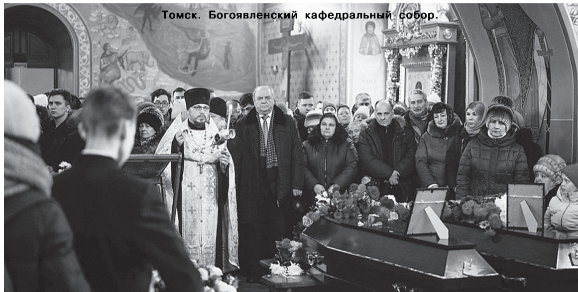
Томск. Богоявленский кафедральный собор.