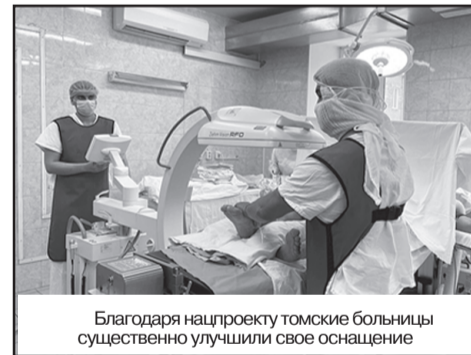
Благодаря нацпроекту томские больницы существенно улучшили свое оснащение