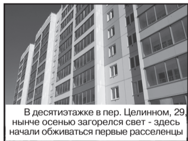
В десятиэтажке в пер. Целинном, 29 нынче осенью загорелся свет - здесь начали обживать первые расселенцы

Десятиэтажка на пер. Целинном, 29 на 200 квартир строилась с весны 2021 года. Этим летом стройка завершилась, а уже осенью в окнах загорелся свет - здесь начали обживать первые новоселы.