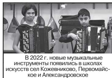
В 2022 г. новые музыкальные инструменты появились в школах искусств сел Кожевниково, Первомайское и Александровское