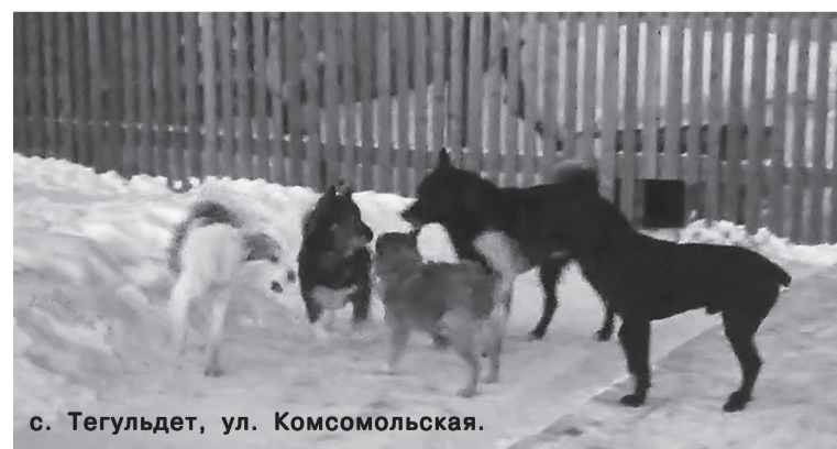
с. Тугульдет, ул. Комсомольская.

Статья 5.2. Допущение нахождения животных без привязи либо в неустановленных местах" гласит: «1. Беспровязное содержание собак, за исключением случаев, установленных законодательством Томской области, - влечёт предупреждение или наложение административного штрафа на граждан в размере от пятисот до двух тысяч рублей.