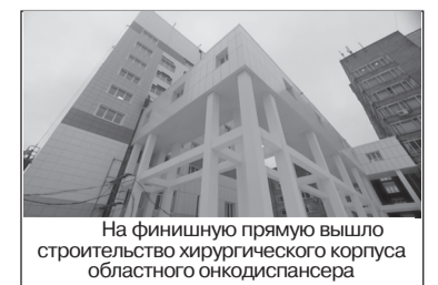
На финишную прямую вышло строительство хирургического корпуса областного онкодиспансера

конца декабря. В городе Асино по нацпроекту завершается строительство детской поликлиники на 200 посещений в смену. Новое здание с действующим корпусом районной больницы соединяет надземный переход. Строители учли, что приходиться в новую поликлинику будут маленькие пациенты: в оформлении фасада и внутренней отделке много ярких оттенков. Но главное, по-прежнему, качество работ - оно должно быть безупречным.