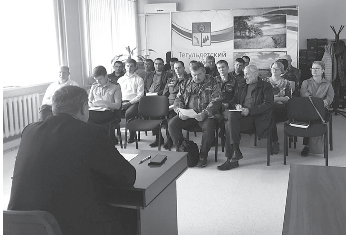
Заседание антитеррористической комиссии по вопросам АТЗ объектов образования.

27-го ноября отмечался день памяти святого апостола Филиппа, одного из учеников Христа. Именно на этот день приходится заговенье, поэтому Рождественский пост в народе часто называют Филипповым, или просто «филиппками».