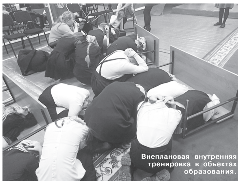
Внеплановая внутренняя тренировка в объектах образования.

На федеральном уровне в настоящее время действует Постановление Правительства РФ от 2 августа 2019 г. № 1006 «Об утверждении требований к антитеррористической защищённости объектов образования».