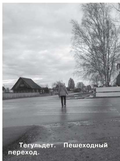
Тегульдет. Пешеходный переход.

Вместе с тем, не поддается никакой критике беспечность родителей в организации проведения профилактических бесед, вос-