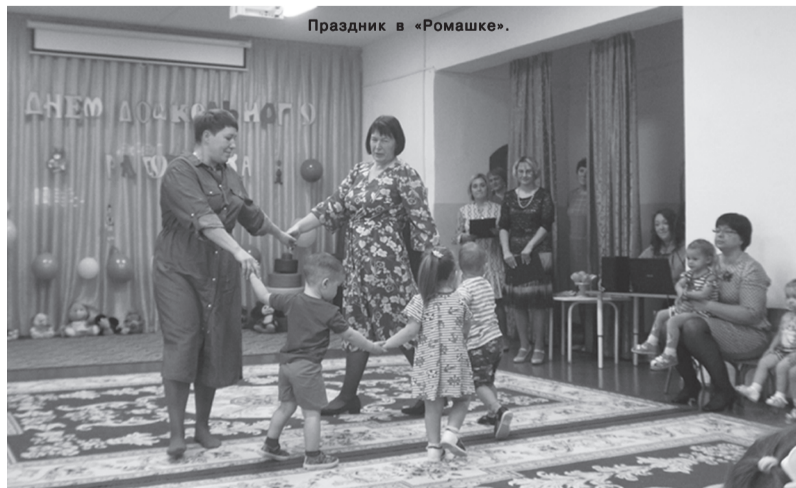
Праздник в «Ромашке».