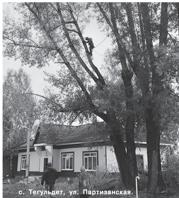
с. Тегульдет, ул. Партизанская.