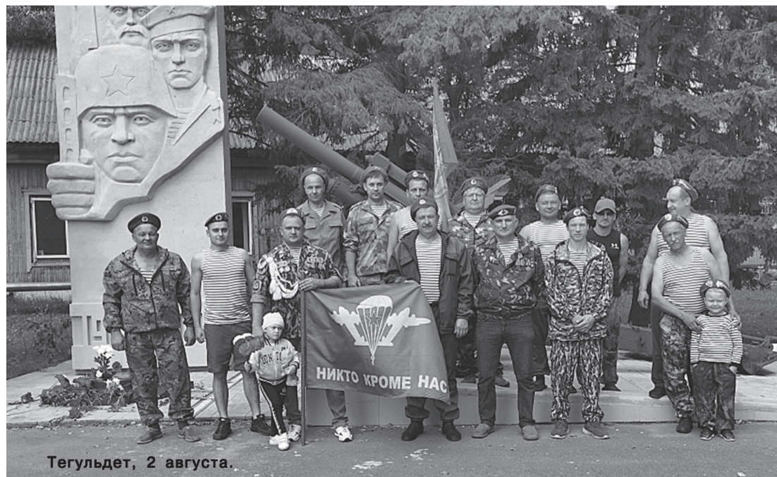
Тегульдет, 2 августа.

Памятная дата берёт начало 2 августа 1930 г., когда десантное подразделение осуществило высадку с самолёта для выполнения боевой задачи. Первое время десантники относились к военно-воздушным войскам, затем - к сухопутным.