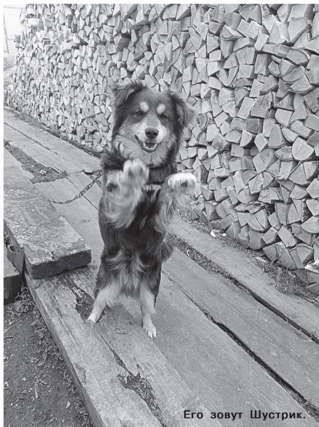
Его зовут Шустрик.

Они живут рядом с нами, большие и маленькие, добрые и злые, опасные и незаметные - всякие. Кто-то пренебрежительно зовёт их дворняжками, кто-то гордо именует двортерьерами. Неоспоримо одно: преданнее друга вам не найти. Во многих населённых пунктах создаются сообщества беспородных собак, организуются выставки. Так что и двортерьеры могут получать награды. Но гораздо важнее то, что у них более