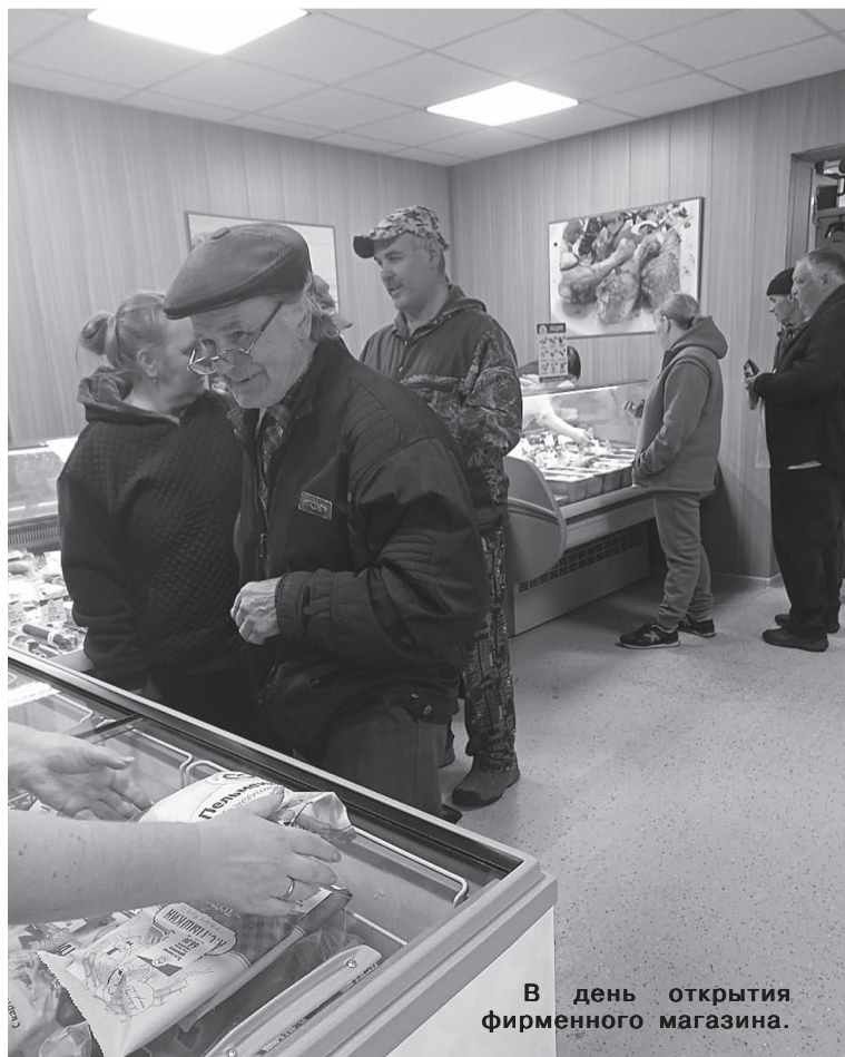
В день открытия фирменного магазина.

ную часть денег люди тратят, по моим наблюдениям, на продукты, на детей и на самое необходимое, которое требуется. Покупательская способность упала. Товар в «Хозяюшке», в основном, сезонный. Может лежать и год. До следующего, допустим, лета. В нашем малолюдном Тегульдете конкуренция по реализации товаров для строительства, ремонта квартир, усадеб, обновления интерьера внушительная. Помимо небольших магазинов, где продаются продо-