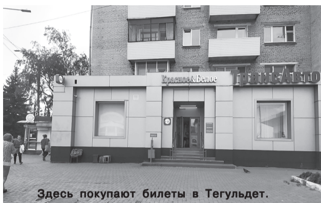
Здесь покупают билеты в Тегульдет.

Билет стоит 584 рубля. Его можно купить в Томске в кассе, причем туда и обратно (пр. Кирова, 66). Если заказывать онлайн-билет, то выйдет дороже, поскольку на сайтах к стоимости билета фирмы накручивают свои цены, для них это выгодно. В Тегульдете кассы нет. «Если пассажир едет до Байгалов, Чёрного Яра, Кучуково, Иловки, Чердат, Зыряки, др., то может рассчиты-