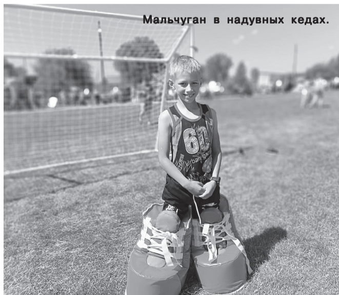
Мальчуган в надувных кедах.