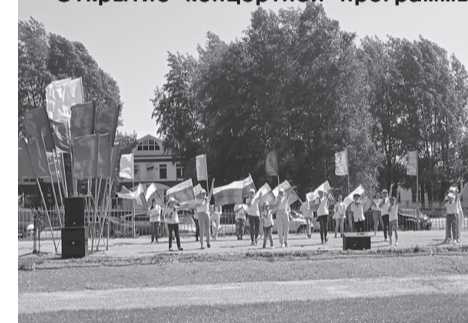
Открытие концертной программы.

Ну а на сцене звучали стихи, песни самодельных артистов из Тегульдета, Берегаева, вокальных ансамблей «Голос», «Микрофон», танцы хореографического ансамбля «Элегия», «Гармония» РЦТиД, ветеранского хора «Родные напевы», «Лейся, песня» из Берегаева. Ребята эстетического развития «Сказка» детского дома творчества сменяли другие артисты. 41 номер - это не