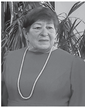
Берегаевский ДДиТ ПОЗДРАВЛЯЕТ председателя Совета ветеранов с днём рождения!