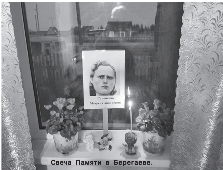
Свеча Памяти в Берегаеве.