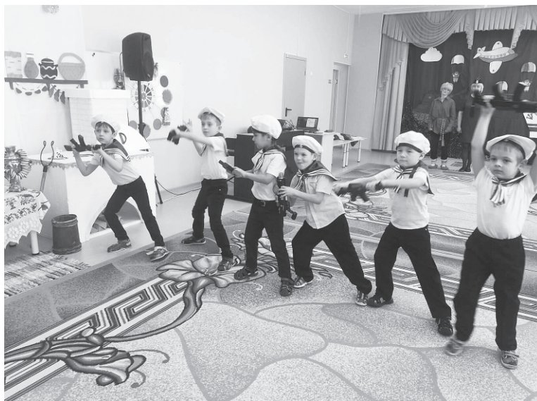
А затем на праздник к детям им внуком Кузей. Домовенок пришла Баба Яга вместе со своим внучком Кузей. Домовенок решил, что хватит ему в домовых

В преддверии праздника в группах дошкольного образования прошли праздничные мероприятия. Праздники начались с торжественного выхода детей с флагами в руках. Дети с гордостью читали стихи о защитниках Отечества, о своих папах, которые проходили службу в Вооруженных силах России, а сейчас защищают и оберегают свои семьи. Ребята весело и с задором исполнили песни «Защитники Отечества» и «Вот мы какие, солдаты молодые!».