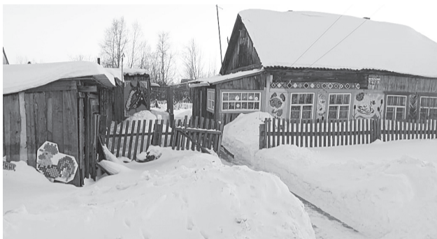
Отголоски новогодних праздников около усадеб творческих берегаевцев.

Администрация Тегульдетского района информирует о возможности предоставления земельного участка из земель населенных пунктов, расположенного по адресу (адресному ориентиру): Российская Федерация, Томская область, Тегульдетский муниципальный район, Берегаевское сельское поселение, п. Берегаево, ул. Кирова, 9, кадастровый номер 70:13:0100003:999, площадью 1500 кв.м, разрешенное использование: для ведения личного подсобного хозяйства (2.2).