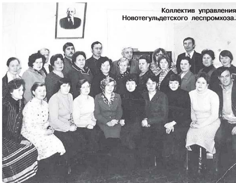
Коллектив управления Новотегульдетского леспромхоза.