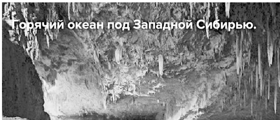
Горячий океан под Западной Сибирью.

Чтобы выяснить, где именно залегают подземные океаны, ученые из Вашингтонского университета обработали порядка 600 тысяч сейсмограмм. Результаты оказались сенсацией: под восточной частью континента Евразии и под Северной Америкой находятся огромные резервуары