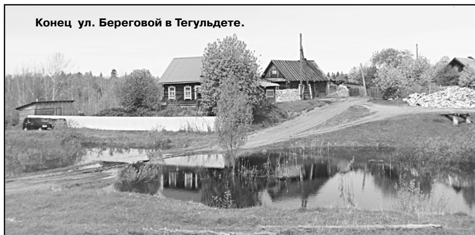
Конец ул. Береговой в Тегульдете.