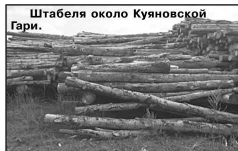
Штабеля около Куяновской Гари.