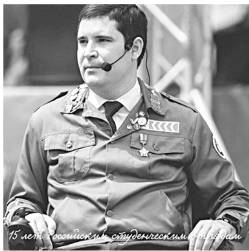
15 лет российским студенческим отрядам

Отдельной задачей вижу – интеграцию молодежи страны в кадровую политику таких сырье-