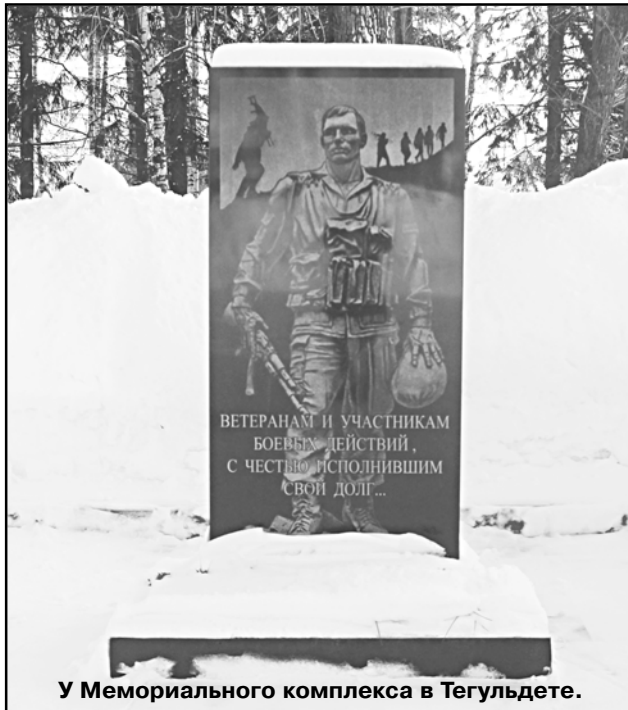
У Мемориального комплекса в Тегульдете.

19 февраля в администрации Томской области состоялось торжественное собрание, по-