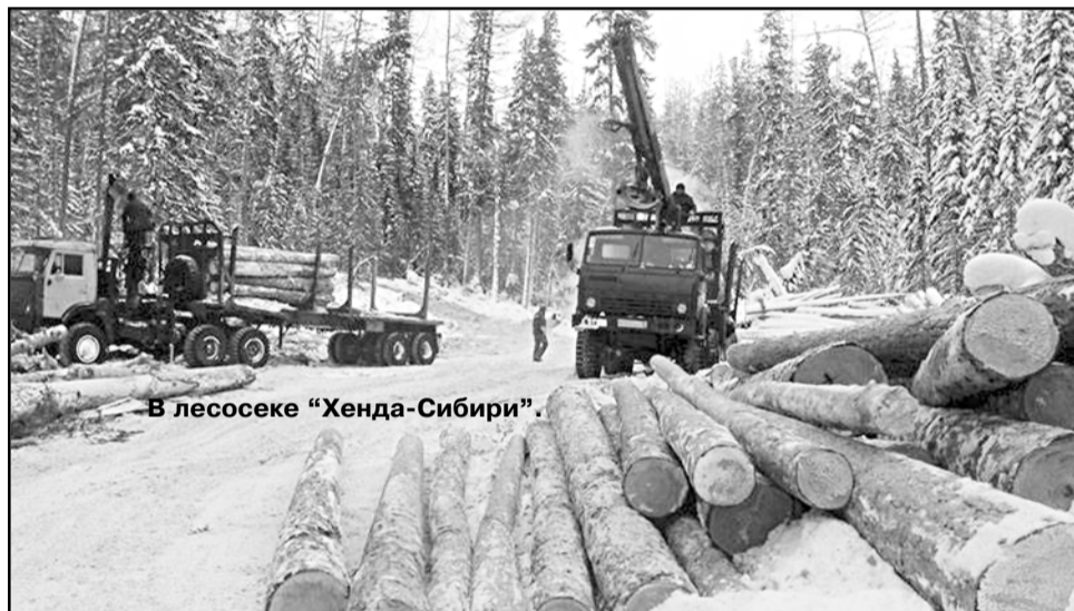
В лесосеке «Хенда-Сибирь».

Население заготовило 34,6 тыс. куб.м леса.