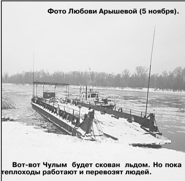
(5 ноября).

Вот-вот Чулым будет скован льдом. Но пока теплоходы работают и перевозят людей.