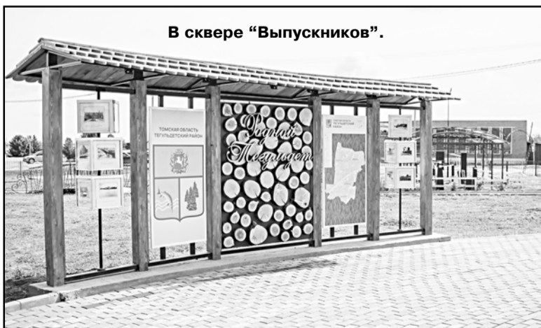
В сквере «Выпускников».