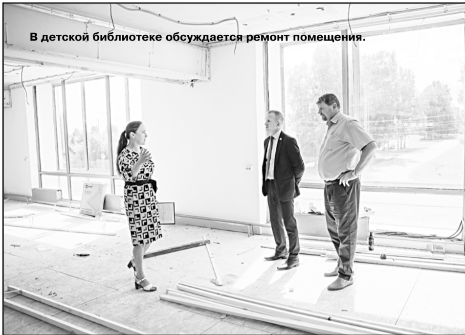
В детской библиотеке обсуждается ремонт помещения.

пальных услуг. Наиболее востребованы услуги федеральных органов власти: УМВД, ФНС, Росреестр, ПФР, - уточнила она.