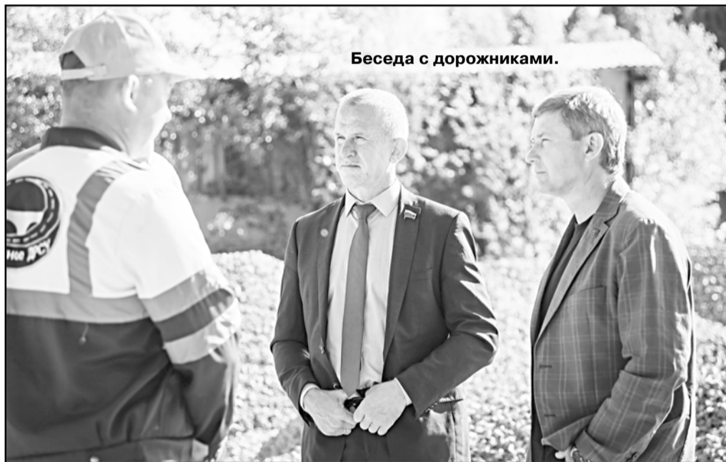
Беседа с дорожниками.

- За два года в отделе ОГКУ «ТО МФЦ» по Тегульдетскому району было зарегистрировано 36 510 обращений граждан. В среднем ежедневно Центр по предоставлению государственных и муниципальных услуг регистрирует порядка 50 - 60 обращений. В отделе предоставляется 167 государственных и муници-