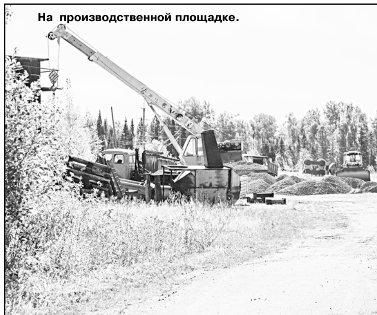
На производственной площадке.

Подготовила к печати Лариса Кириленко.