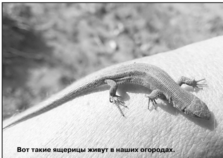
Вот такие ящерицы живут в наших огородах.

Многочисленные мифы о получении человеком огня в качестве “героя”, добывающего пламя, упоминают именно ящерицу. Так, Камбел отправлял по очереди ящериц разных видов, и только самой маленькой удалось добраться до пандануса, под которым находился огонь, миновать охрану и вернуться, держа огонь под мышкой, чтобы вода не попала на него. Забавная деталь: Камбел не мог найти огонь, который ящерица, играя с хозяином, прятала от него.