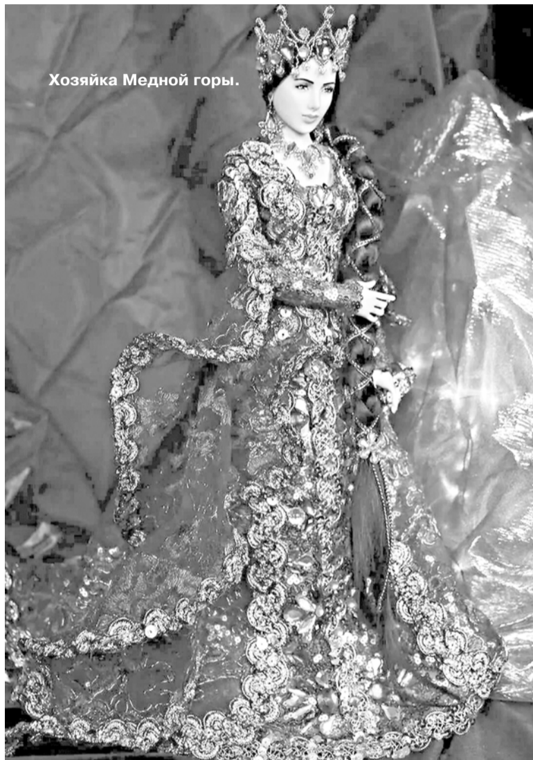
Хозяйка Медной горы.

В нашем районе встречается довольно много ящериц. Например, пряткая, занесенная в Красную книгу, не превышает 25-27 см, из которых более половины приходится на хвост. Окраска и рисунок покровов довольно изменчивы. Верхняя часть тела половозрелых самцов чаще всего зеленая, у самок и молодых особей, за редким исключением, коричневатая разных тонов. Брюшная сторона тела самцов и самок желтовато-зеленая.