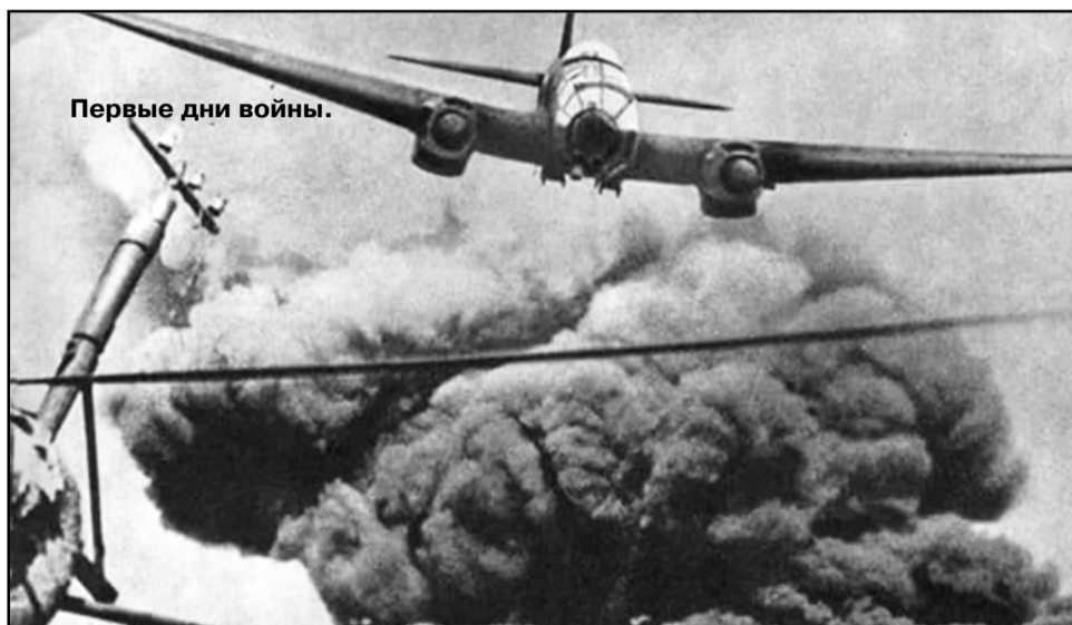
Первые дни войны.

Вместе с Германией к войне с СССР готовились ее союзники: Финляндия, Словакия, Венгрия, Румыния и Италия. Всего же