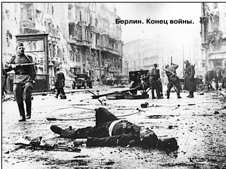
Берлин. Конец войны.