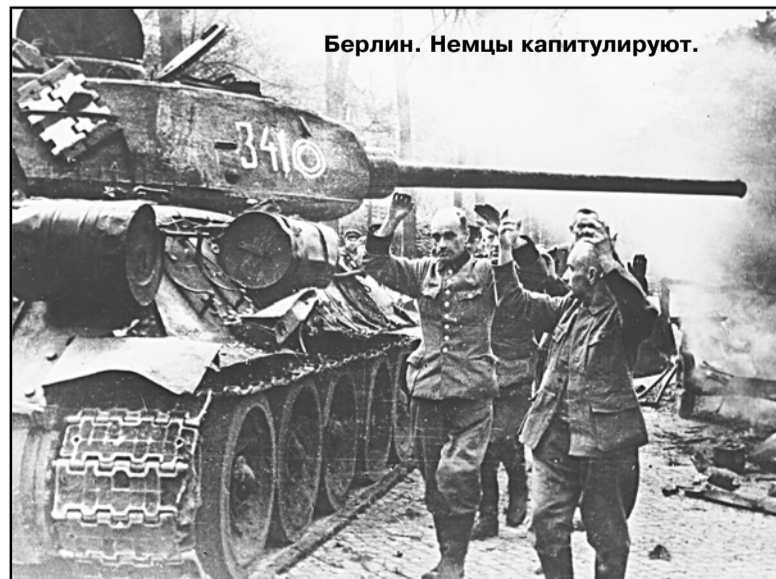
Берлин. Немцы капитулируют.