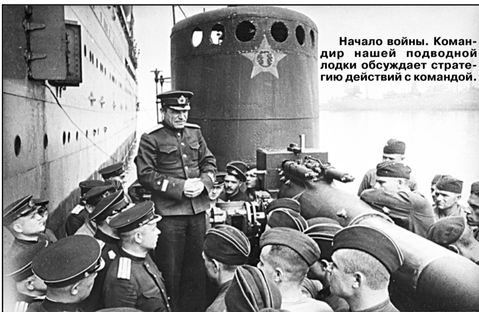
Начало войны. Командир нашей подводной лодки обсуждает стратегию действий с командой.

ставило - 869900 человек; расчетных дивизий - 42,5; орудий и минометов - 6673; танков - 402; самолетов - 964.