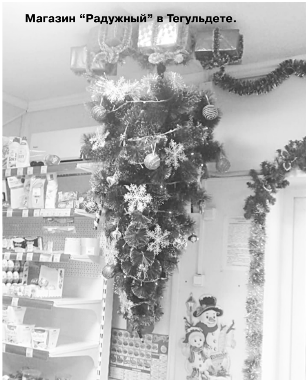
Магазин «Радужный» в Тегульдете.

Какое предприятие было украшено к Новому году лучше всех?