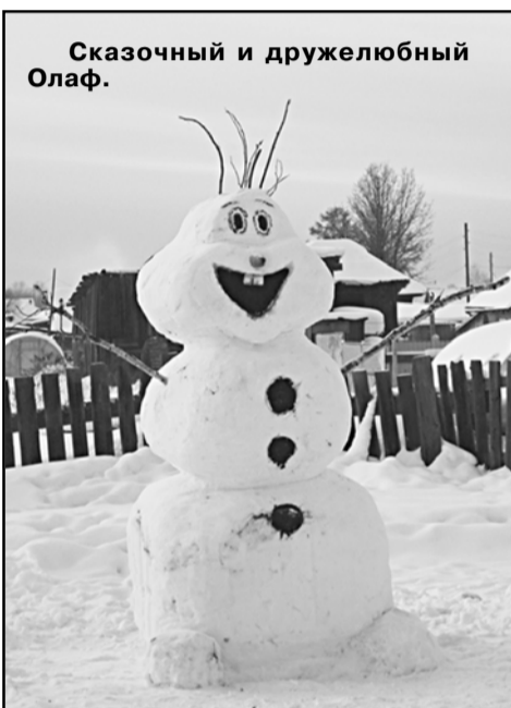
Сказочный и дружелюбный Олаф.