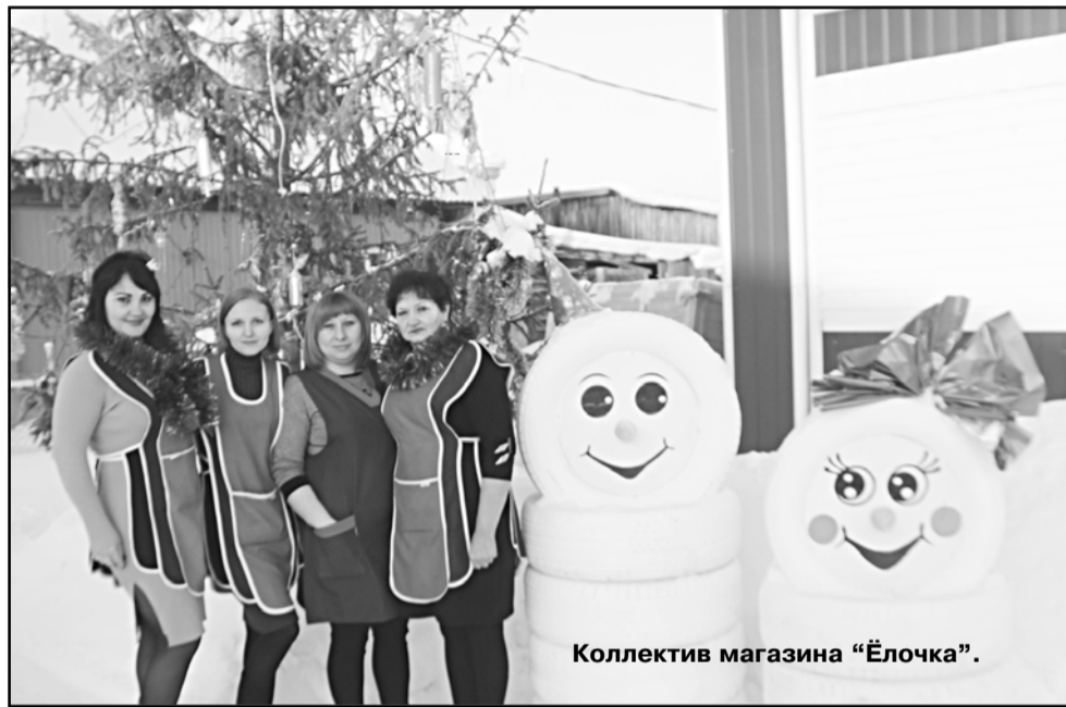
Коллектив магазина «Ёлочка».