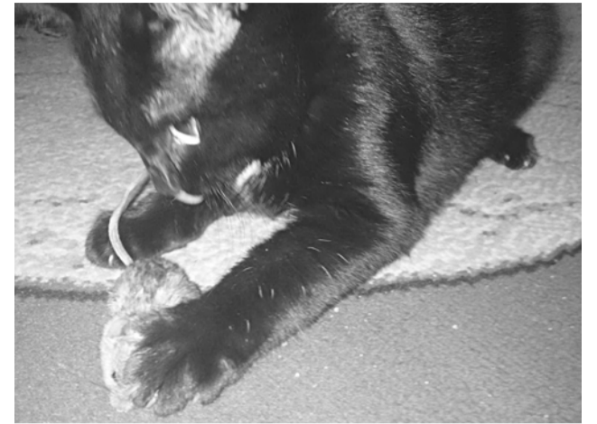
Малыш "Тихон" вернулся домой с охоты.