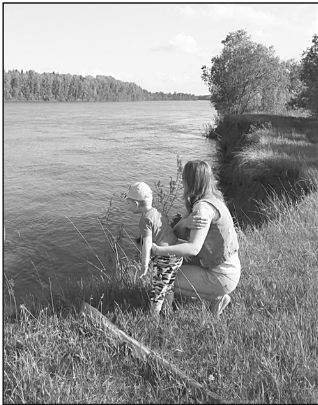
Чулым-река, где пролетело детство - Прекрасная, как дивный сон, пора...

Итоги будут подведены в День печати - 13 января.