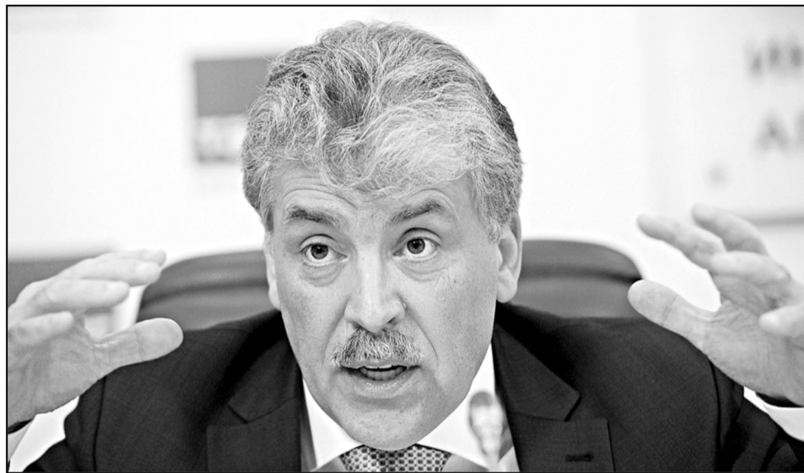
Делиться “бедному” директору совхоза с бывшей женой практически нечем: 7,5 млрд руб. находятся на счетах в зарубежных банках.