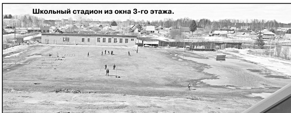
Школьный стадион из окна 3-го этажа.