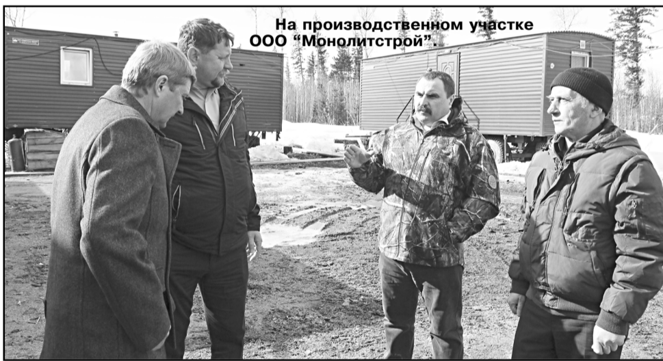
На производственном участке ООО «Монолитстрой».