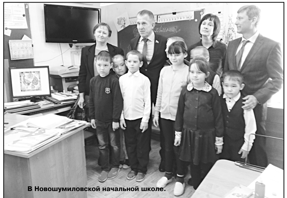
В Новошумиловской начальной школе.