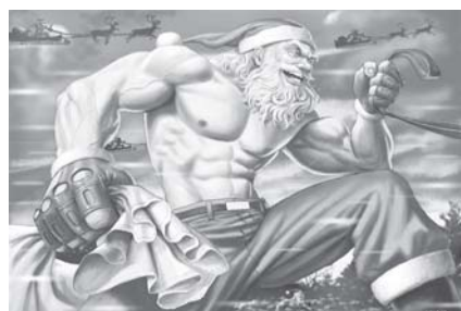
Рисунок Сергея Демко.

Коллеги по работе в яслях-саде «Буратино»