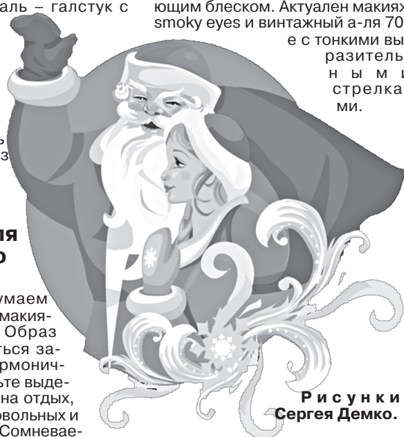
Рисунки Сергея Демко.