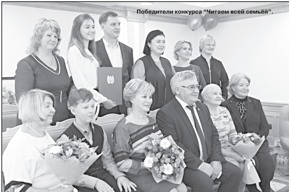
Победители конкурса «Читаем всей семьёй».

В девятый по счёту раз в конкурсе приняли участие самые читающие семьи. 12 октября в областном парламенте прошла церемония награждения победителей конкурса «Читаем всей семьёй».