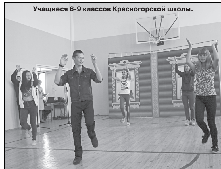
Учащиеся 6-9 классов Красногорской школы.