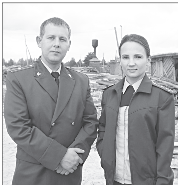
сфере лесного бизнеса гостям понравился. Они, изучив доку-