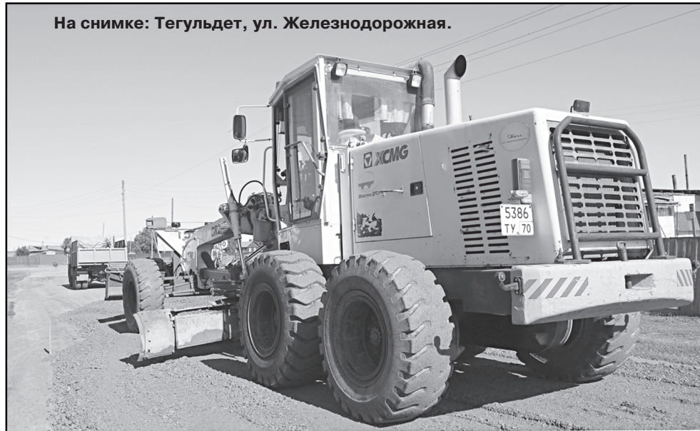
На снимке: Тегульдет, ул. Железнодорожная.

Когда на какой-то улице идёт ремонт дорожного полотна, то жители других начинают сетовать, почему не на их улицах ведутся работы. Но понимают, что финансирование не позволяет вмиг благоустроить весь райцентр. Хотя уже в ближайшее время дорожники, исходя из погодных условий, планируют приступить к асфальтированию вторым слоем центральных улиц, по которым наиболее интенсивное движение. Помимо этого, будут оборудованы парковочные стоянки, например, около аптеки, Православной церкви и детской игровой площадки. Так, в рамках социального партнерства руководство аптеки направляет определенную сумму для этой цели. Чтобы село преобразилось, улучшался внешний вид, населению предлагается принять участие в благоустройстве, выделив средства на асфальтирование подъездных путей, дорожек к личным участкам. Так, по словам начальника дорожного участка Андрея Мельника , 1 кв. м асфальтобетонной смеси (тол-