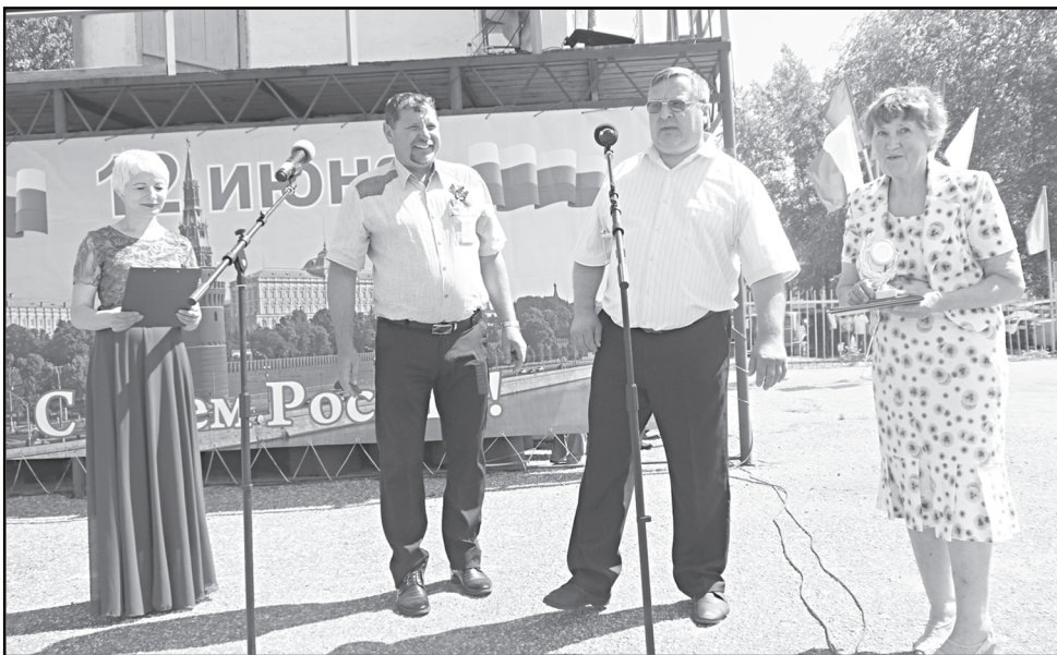
«Касаясь трех великих океанов, Она лежит, раскинув города, Покрыта сеткою меридианов, Непобедима, широка, горда».

12 июня в Тегульдете состоялось праздничное мероприятие, посвященное Дню России. Уже с утра на стадионе «Таёжный» звучала тематическая музыка, поднимая настроение сельчанам, которые, оставив на несколько часов домашние заботы, посадку огородов, собрались к 12 дня на общий и уже всеми любимый, хоть и новый в истории нашего государства, праздник.