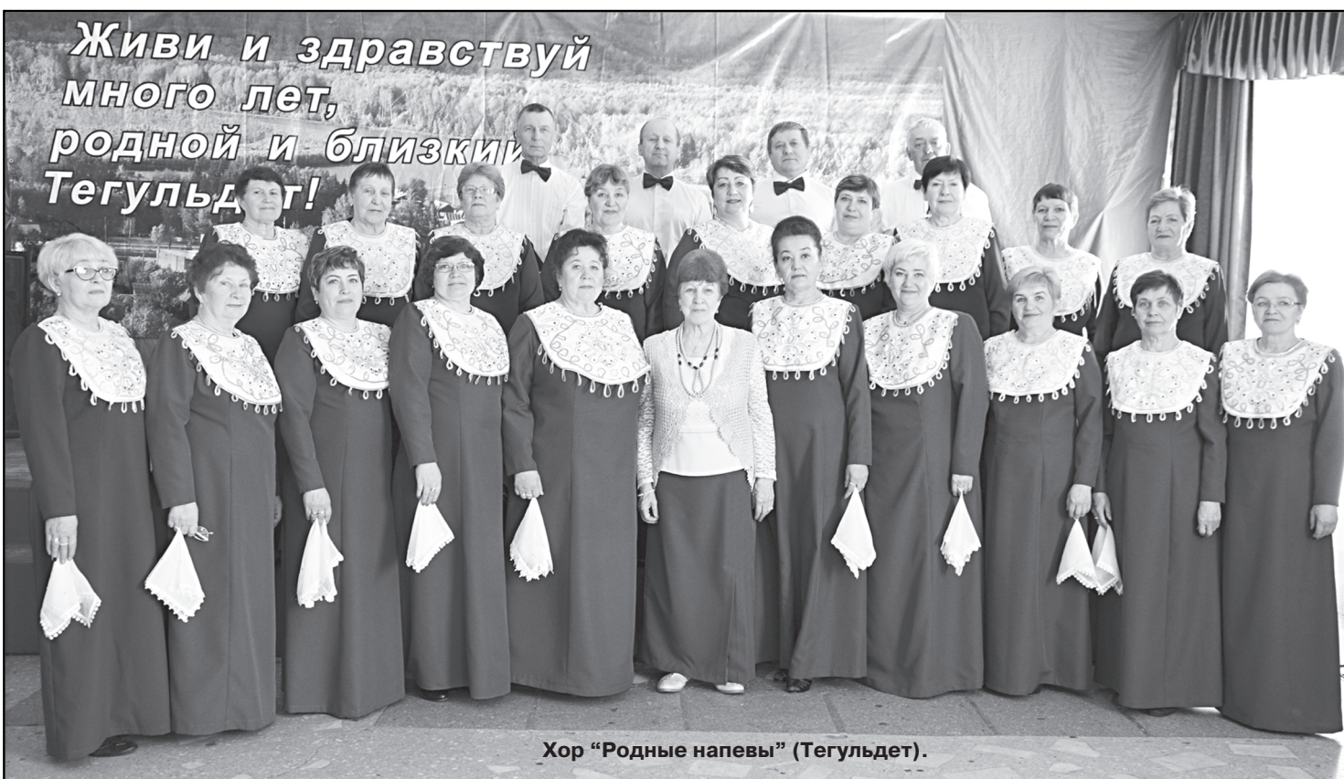
Хор «Родные напевы» (Тегульдэт).

На минувшей неделе Тегульдетский район встретил 185 участников 29-го областного конкурса-фестиваля ветеранских хоров «Салют, Победа!», посвященного 73-й годовщине Победы советского народа в Великой Отечественной войне и 100-летию Комсомола. Гости приехали из Томска, Асиновского, Первомайского, Зырянского районов.